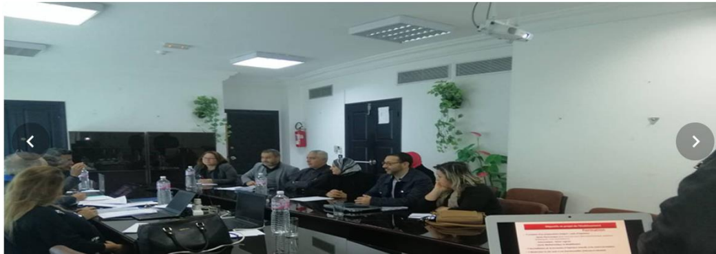
Fig 3. Réunion d'audit avec l'équipe d'évaluation – "trial accreditation" à l'ISIMM