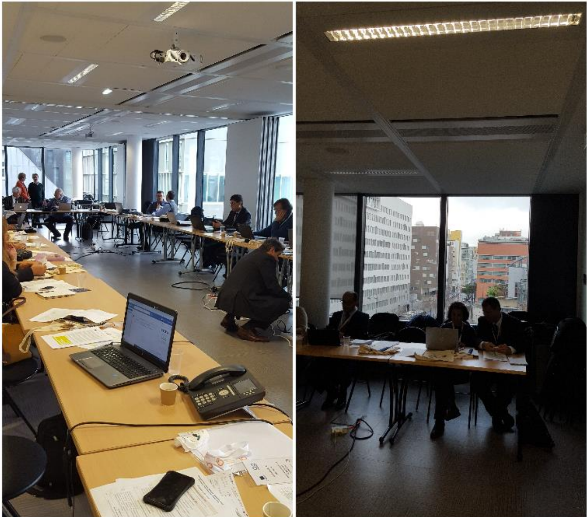
Fig 5. Participation à la réunion de coordination à paris